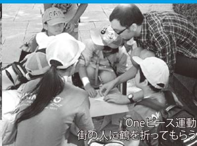
Oneピース運動 街の人に鶴を折ってもらう