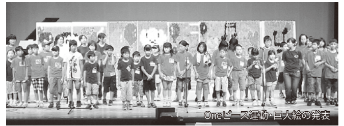
Oneピース運動・巨大絵の発表