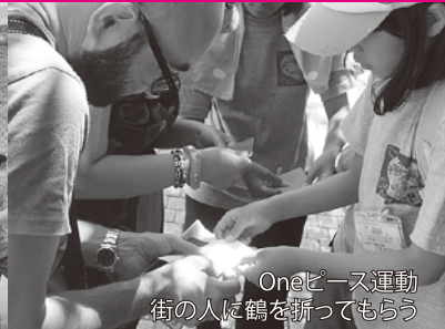
Oneピース運動 街の人に鶴を折ってもらおう