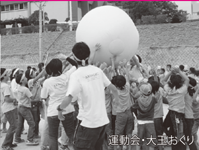
運動会・大玉おくり