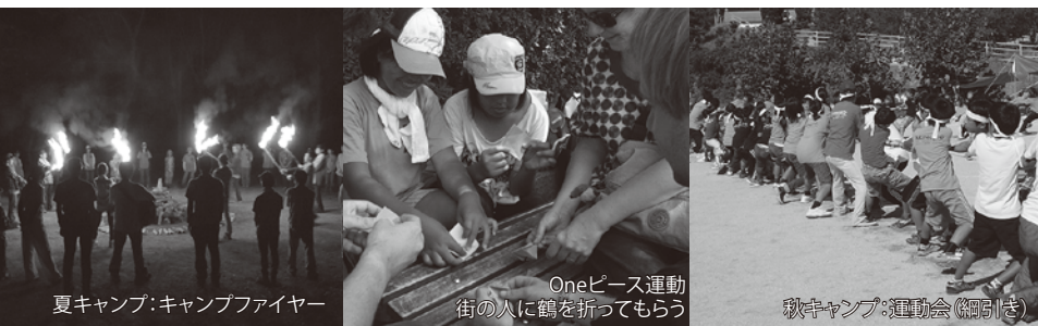
夏キャンプ: キャンプファイヤー

スタッフは「子どもの成長には多様な体験の場が必要である」との思いをもつ小中学校の先生が中心です。学校生活とは一味違った体験を通して、自分の新しい一面を発見してみませんか？