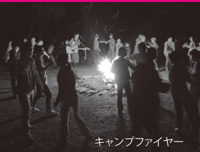
キャンプファイヤー