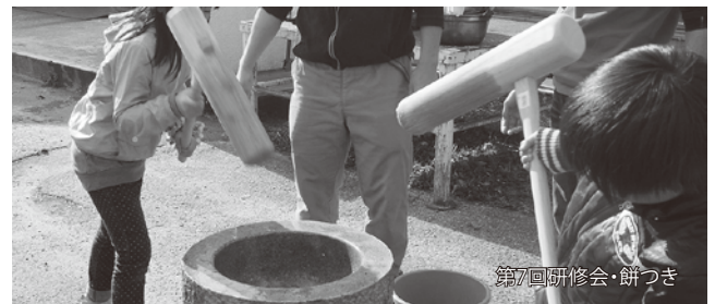
第7回研修会・餅つき