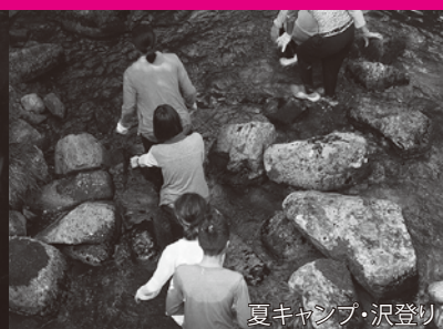
夏キャンプ・沢登り