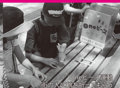
Oneピース運動 街の人に鶴を折ってもらおう